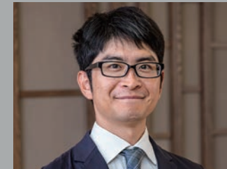
ダイナテック株式会社 ソリューション営業部 営業2課 課長

「初めてワコム液晶ペンタブレットに触れた際に手書きと変わらない書き心地を体験し、『これならばペーパーレス化を実現できる』と確信しました」