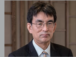
株式会社相鉄ホテルマネジメント ホテルサンルートプラザ新宿 総支配人